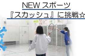
NEW スポーツ 『スカッシュ』に挑戦☆