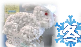
干支のうさぎ作り