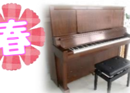
ピアノがラウンジに登場! ステキな音色が響きます☆