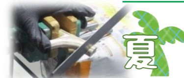
エゾシカの角で工作!