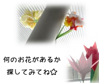
何のお花があるか 探してみよう☆