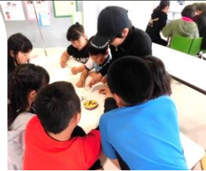
5月 ボードゲーム大会 “ダブル”の説明と進行をしたよ

今年度もこども会議メンバーを募集しています！ 活動の中心となる中高生の参加もまっているよ♪