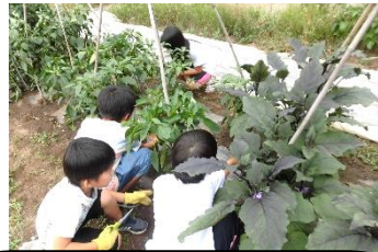
7月 ナス・ピーマンの収穫

あいぽーとにある畑で、みんなで野菜づくり！ 土おこし、種まき、水やり、収穫、観察など、 色々な活動を行います。