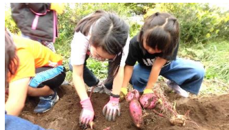
10月 サツマイモ掘り