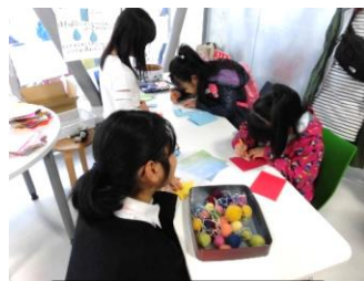
10月 こどもまつり オーナメントの販売と ワークショップをしたよ