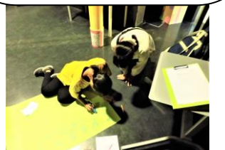
イベントの企画・準備中