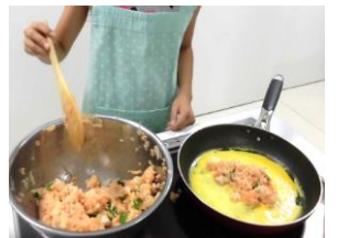
昨年度は肉じゃがや オムライスを作ったよ