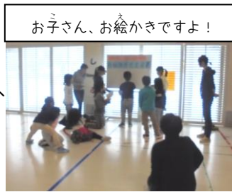
お子さん、お絵かきですよ！

2018年をどんなあいぽーとにしたいかインタビュー&アンケートBOXを設置するよ！