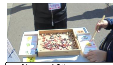
どの種がどの野菜かわかるかな?

10月21日(日)に行われた『2017いしかり児童館こどもまつり』は、たくさんのお客さんに楽しんでもらえて、大成功だったよ! こども会議支部や、のら～ず支部の実行委員も、おまつりを盛り上げるために、9月からずっと準備を頑張ってきたね! みんなの笑顔があふれる素敵なおまつりでした!