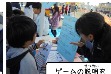
ゲームの説明を しっかり伝えます!