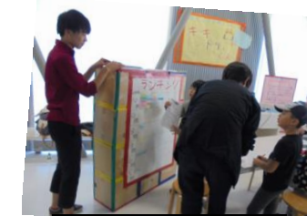
小学生にやさしく説明♪