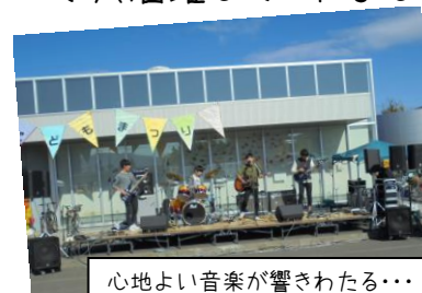
心地よい音楽が響きわたる...

10月21日(日)に『2017いしかり児童館こどもまつり』が行われました！ きれいな秋空の下で、高校生グループによるバンド演奏や、中学生ダンスチームによるパフォーマンスなど、ステージの上でかっこよく輝く中高生の姿が！！ 館内では、「キキトリくん」という、音当てクイズを担当。中高生だからこそ出せるパワーで大活躍してくれました♪