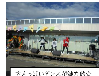
大人っぽいダンスが魅力的☆