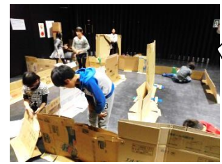
迷路はダンボールで作ったよ☆

こども会議 こどもの代表として意見を出したり まとめたり、イベントの企画をするよ！ 11月は、あそびの日イベントの企画・運営をがんばりました！ まっ暗な文化活動室の迷路をたどって、宝探しと謎ときをしたよ。 とっても楽しいイベントになりました♪ 大成功だったね☆ 次回の会議は 12月10日(土) 11:00～12:00、1月7日(土) 時間未定 内容：新年会について